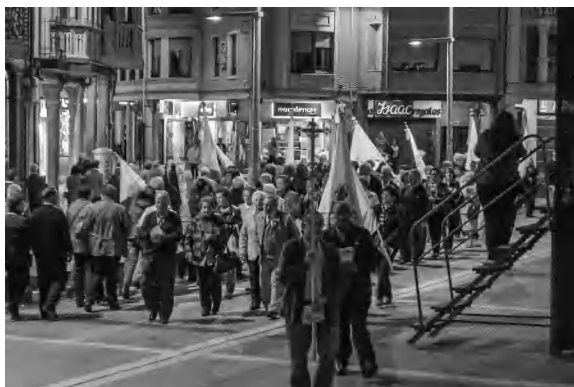
El Consejo Diocesano asistió a la celebración del 75 Aniversario de la Sección de ANE de La Bañeza.

Los días 10 a 12 de julio, en Ávila tendrá lugar el XII Encuentro Nacional de Jóvenes Adoradores . Pueden participar todos los jóvenes interesados. Para ello deben contactar a través del Consejo con los responsables de jóvenes.